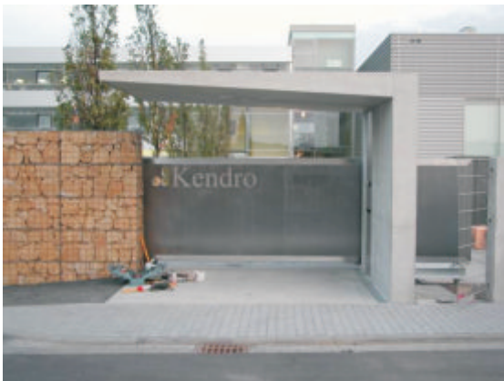
Freitragendes Schiebetor aus Edelstahl, geschliffen

Gewerk: - Geländer nach Gestaltungsentwurf Innenbereich - verschiedene Stahlkonstruktionen - freitragendes Schiebetor aus Edelstahl (geschliffen)